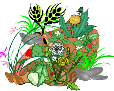
たった1週間でも 雑草だらけ