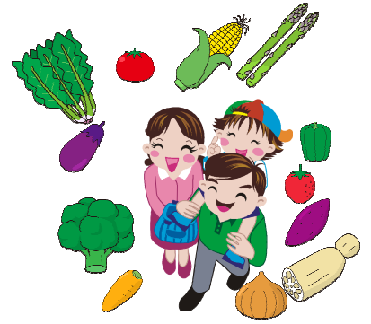
食育や家族での収穫の楽しみ